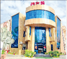
महेंद्रगढ़। आरपीएस विद्यालय।