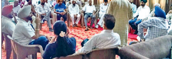
सिरसा। राष्ट्रीय सेमिनार की तैयारियों को लेकर समिति के सदस्य बैठक करते हुए।

श्री गुरु तेग बहादुर के 350वें शहादत दिवस के उपलक्ष्य में श्री गुरु तेग बहादुर: शब्द एवं शहादत विषय पर 4 व 5 अक्टूबर को राजकीय नेशनल महाविद्यालय सिरसा के मल्टीपुर्पज हॉल में होने वाले नौ दिवसीय राष्ट्रीय सेमिनार की तैयारियों को लेकर आयोजन समिति की बैठक हुई। बैठक में सेमिनार के सफल आयोजन के लिए विभिन्न समितियों का गठन किया गया। निर्णय लिया गया कि इस दो