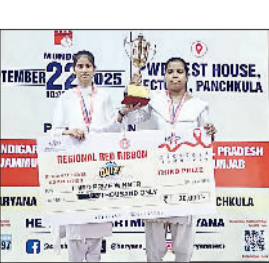
फतेहाबाद। रिजनल रेड रिबन क्विज प्रतियोगिता में अव्वल रही हरियाणा का नेतृत्व कर रही जिले की छात्राएं।