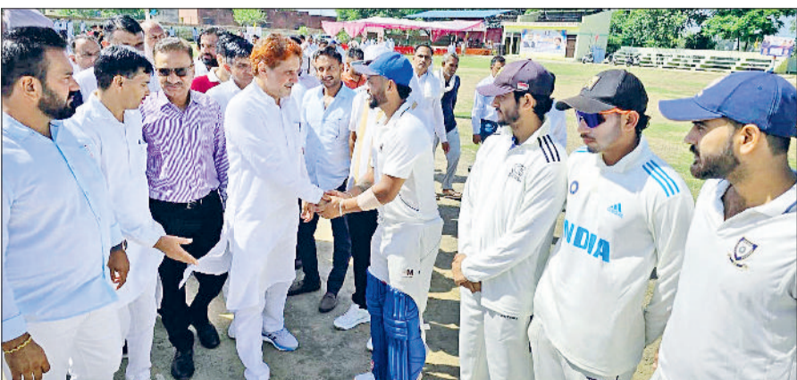
टोहाना। खिलाड़ियों से मिलते सांसद सुभाष बराला।

सांसद खेल महोत्सव के अंतर्गत शहीदी दिवस के अवसर पर गांव डांगरा के खेल मैदान में क्रिकेट टूर्नामेंट का शुभारंभ किया गया। इस अवसर पर राज्यसभा सांसद सुभाष बराला ने मातृभूमि की रक्षा में अपने प्राण न्योछावर करने वाले अमर शहीदों को नमन करते हुए टूर्नामेंट का उद्घाटन किया। राज्यसभा