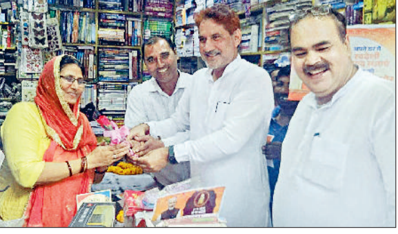
सुधारों पर उन्होंने विस्तृत चर्चा की। इस अवसर पर उन्होंने व्यापारियों और उपभोक्ताओं को वस्तु एवं सेवा कर (जीएसटी) से संबंधित नई जानकारी प्रदान की

राज्यसभा सांसद सुभाष बराला ने मंगलवार को टोहना शहर में व्यापारियों और दुकानदारों से डोर टू डोर मुलाकात की और उन्हें जीएसटी कम होने की बधाई और शुभकामनाएं दीं। केंद्र सरकार द्वारा किए गए हालिया जीएसटी