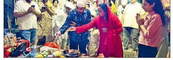
फतेहाबाद। दुर्गा महोत्सव का शुभारंभ करते अतिथिगण।